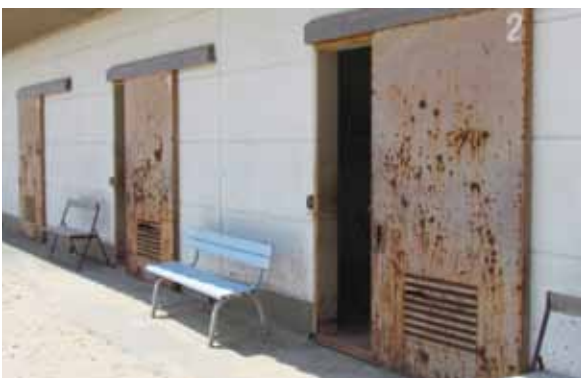
扉を取り替える部室棟