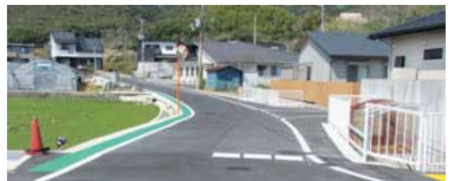
完成間近の御所ノ前線（小中地内）

答 産業建設課長 橋梁点検事業は、点検時の通行規制など警察や地元との調整、町道御所ノ前線は、県道との取り合わせ部分での安全協議、町道谷口中志賀線は工法変更等の協議に、それぞれ時間を要したため。