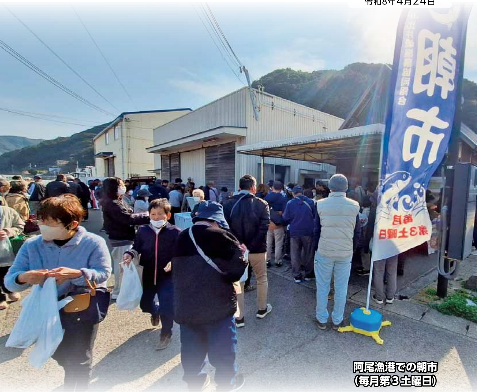
阿尾漁港での朝市 (毎月第3土曜日)