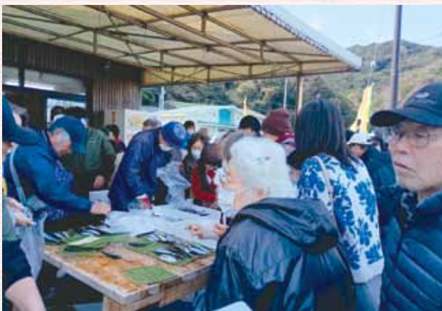
朝市は毎月第3土曜日の9時から

当町においても比井崎地区の人口は減少しており、比井崎漁協の組合員数も同様に減少している。また、漁獲高の低迷が続き、漁業経営は非常に厳しくなっている。更には漁業従事者の高齢化、後継者不足に加えて、資材