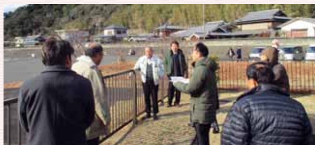
大型浄化槽の設置予定地（小浦）

その責務を果たしていくためにも、持続可能な施設運営が継続できるよう、中長期的な視点に立った、計画的な取り組みを町当局に求めるとともに、本委員会としても、その状況を引き続き注視していくものである。