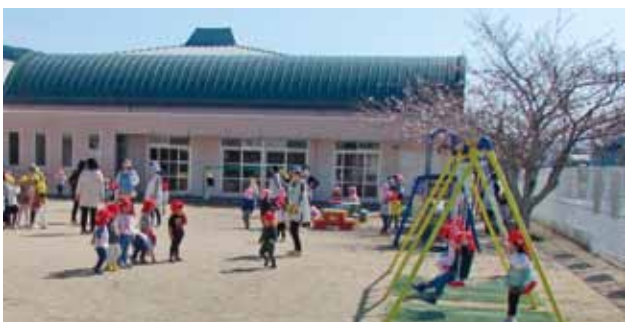
こども誰でも通園制度が始まる

答 子育て福祉健康課長 基本的には一時保育と変わらないので、特に保育士の負担は増えないと考える。