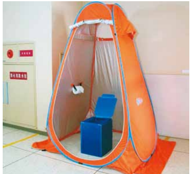
トイレテントを各地区に（イメージ図）

答 総務課長 令和8年度の新たなものとして、テントのついたトイレセットとカセットコンロ、ボンベのセットを各地区に配備する。