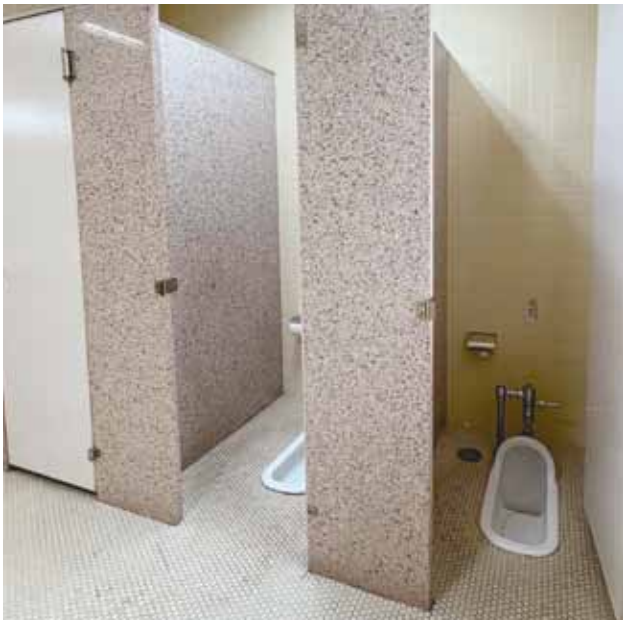
改善を待つ農改センタートイレ

問 トイレの洋式化と温水洗浄便座の設置は、あらゆる施設で当たり前のこととして取り組まれている。