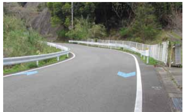
水道管を布設替え (津久野・小浦間の県道)

また、比井地区の県道に布設されている管路において、漏水が認められたため止水弁を2カ所に設置する。