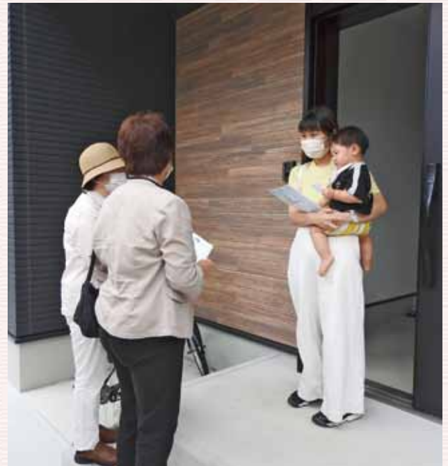
家庭を訪問し、子育てを応援

当町では令和6年度から訪問型家庭教育支援に取り組み、子育てに関する情報や学習機会の提供、相談体制の充実をはじめとする、きめ細かい家庭教育支援を行うことにより、地域全体で家庭教育を充実させていくことを目的として、「日高町家庭教育支援チーム 子育てネット えがお」を立ち上げた。