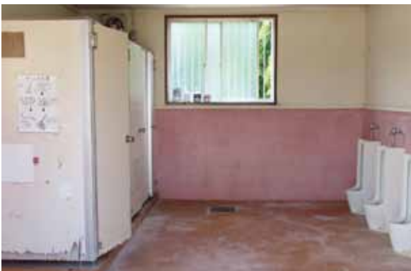
洋式になる部室棟トイレ

答 教育課長 女性用トイレが洋式4基、和式1基、男性用トイレは洋式2基、和式1基、小便器3基の予定。