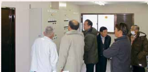
引き続き使用される既存施設内（小浦処理場）

大型浄化槽への更新が予定されている小浦処理場について現地視察を行い、浄化槽の設置予定地や、更新後も引き続き使用される既存施設の状況について詳細を聞いた。