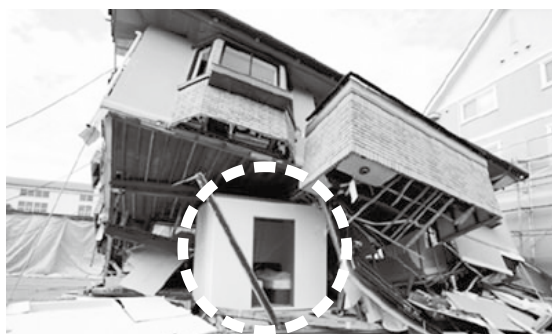
耐震シェルターの一例