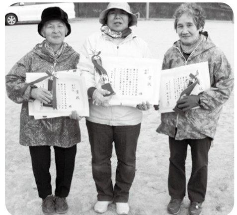
結果 (同スコアの場合ホールインワン数、年齢上位を優先)