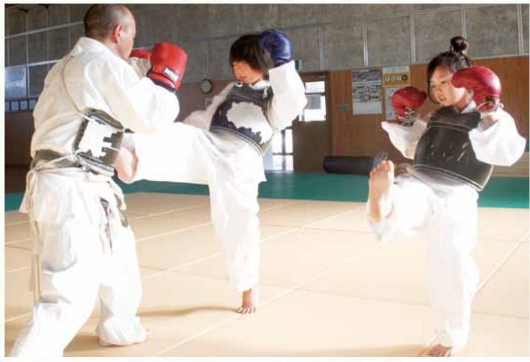
チーム日高（日本拳法）