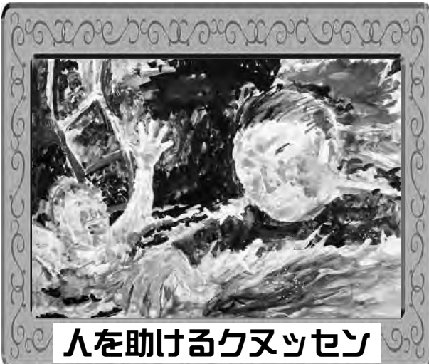
人を助けるクヌッセン