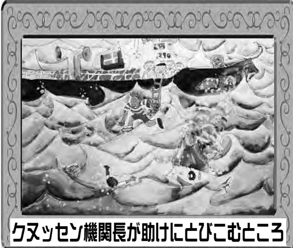
クヌッセン機関長が助けにとびこむところ

ちがう国の人を助けるために、あれた海にとびこんだクヌッセンのゆうかんさを絵にかきました。