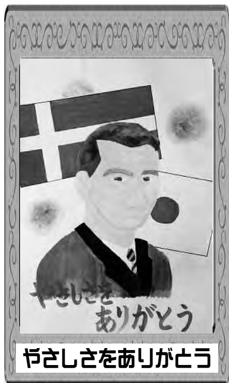
やさしさをありがとう

日本とデンマークの国旗を書いてつながりをイメージし、青色を水とまぜて海をイメージしてオシャレな感じにしました。