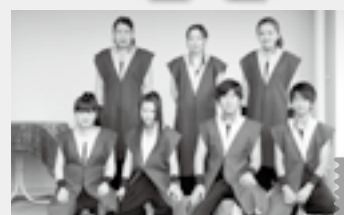
※都合により出演者が変更になることがあります。 演奏会 和太鼓集団 和 響

お申し込み お問い合わせ 主催/九絵の町づくり推進実行委員会 〒649-1213 和歌山県日高郡日高町高家639-4(日高町商工会内) TEL:0738-63-3611 FAX:0738-63-3419 ■ http://www2.w-shokokai.or.jp/hidaka/ ■ http://www.hidaka-kue.jp/