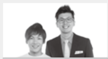
トークショー 和歌山県住みます芸人 わんだーらんど

ところ 産湯海水浴場駐車場 ※イベント会場周辺には駐車場がないため、随時阿尾漁港内からバスでご案内致します。 荒天中止