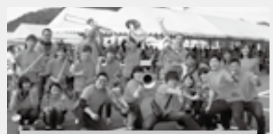
演奏会 消炎鎮痛楽団