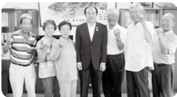
原谷チーム(ゲートボール)

秋田県で開催された第30回全国健康福祉祭あきた大会(ねんりんピック秋田2017)に出場を決めて、日高町内のチームが松本町長を表敬訪問しました。