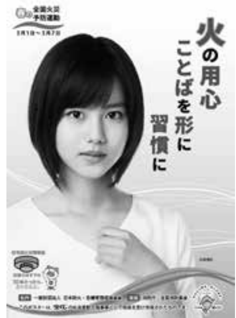
平成30年春の火災予防運動ポスター (一財)全国消防協会作成