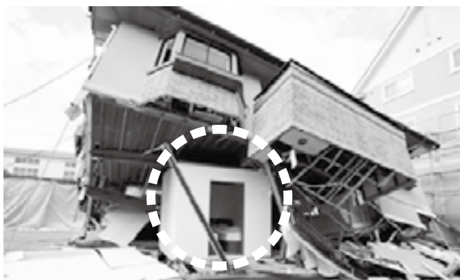
耐震シェルターの一例