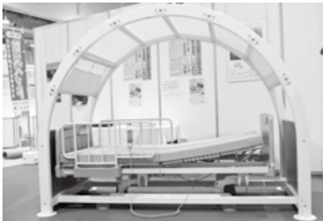
耐震ベッドの一例