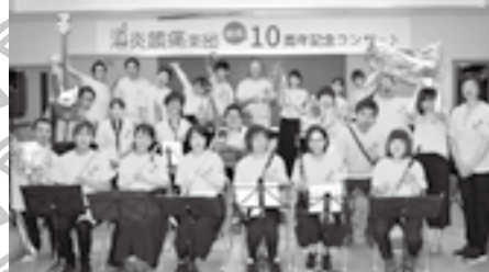
演奏会 消炎鎮痛楽団