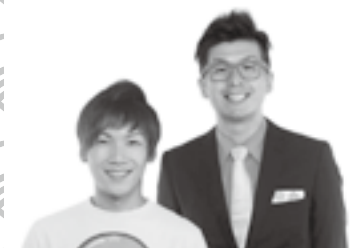
トークショー 和歌山県住みます芸人 わんだーらんど