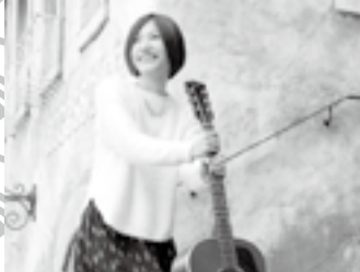
ライブショー シンガーソングライター さつきのあき