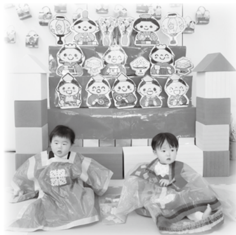
可愛い♥♥おだいり様とおひな様に変身しました♪