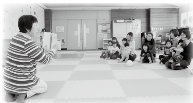
絵本・紙芝居楽しかったね♪

※ 0～3歳の未就園児とその保護者の方が、対象となっています。 ※ 月～金 午前 9:00～12:00 午後 13:00～16:00 お問い合わせは、子育て支援センター (☎70・4140) まで。 (保健福祉総合センター内)