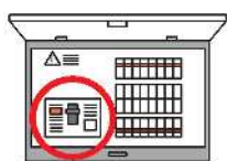
分電盤タイプ(内蔵型)