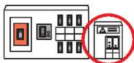
分電盤タイプ(後付型)