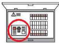
分電盤タイプ(内蔵型)