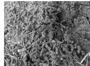
株元に溜まったフラス