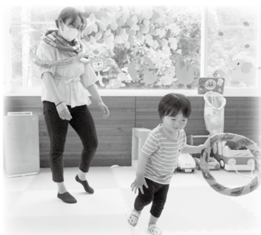
ママに輪投げしたよ〜♪ (*^^*)