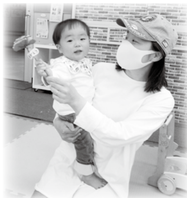
お母さん、いつもありがとう (*^^*) ♪