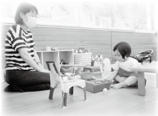
おままごと♡ 今日のごはん、なに食べた〜い? (*^^*)