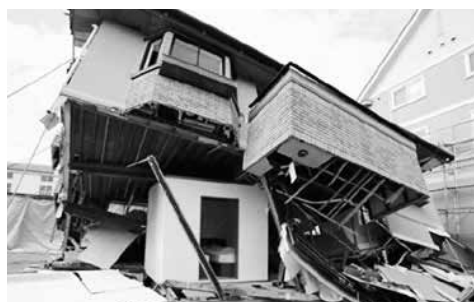
耐震シェルターの一例