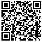
森林の立木伐採について