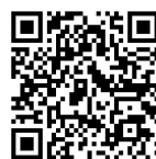
森林の土地の所有者届出書

【 http://www.town.wakayama-hidaka.lg.jp/docs/2014090400235/ 】からもダウンロードできます。)