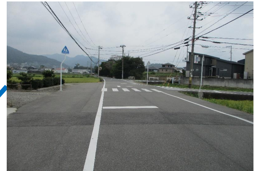
④ 町道白馬線（坂本繊維工場東側の横断歩道） 荊木地区の住民が国道に出るための道となっ ており、見通しがよく車両も速度を上げている。