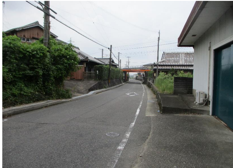
① 県道井関御坊線（東光寺公民館から国道まで） 児童が登校する時間に通勤車両が多く通行し、 道幅も狭く歩道がないため危険である。