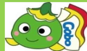
ハローワーク御坊マスコットキャラクター まめびー